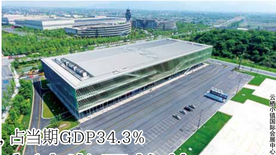
云栖小镇国际会展中心

10月13日,2016杭州·云栖大会将在云栖小镇拉开帷幕。本届大会连开4天,规模翻倍,网聚各行各业精英,呈现450场主题演讲,探讨“互联网+”的深入推进,感受最新的科技应用成果……云栖大会正朝着全球规模最大的云计算科技盛会迈进,而云栖大会的成长也见证了我区信息经济的蓬勃发展。