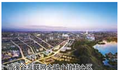
西溪谷互联网金融小镇核心区